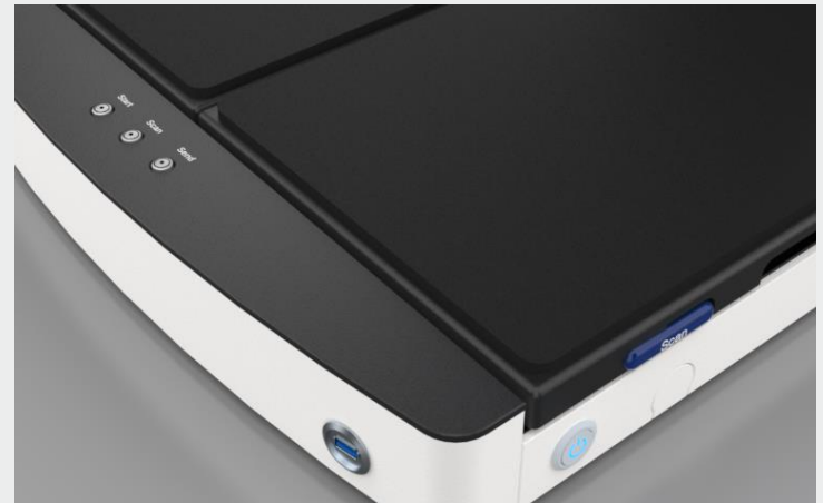
Charge les images sur n'importe quel périphérique USB via le port USB 3.0