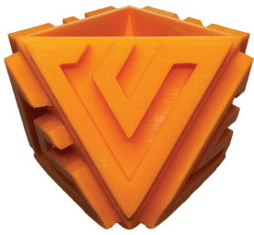
Original 90×65 mm