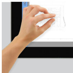
Écran tactile Écran tactile full HD 21,5 pouces