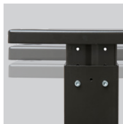
Support à hauteur réglable