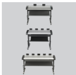
Votre choix de scanner IQ Quattro X 44 pouces HD Ultra X 42 pouces HD Ultra X 60 pouces