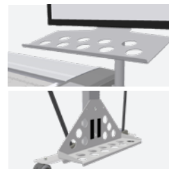
Support de clavier et panier de PC

Les solutions Contex sont compatibles avec toutes les principales imprimantes grand format. Découvrez la liste complète sur contex.com/nextimage-supported-printers